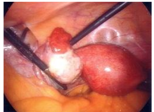
Laparoscopie van eileiders